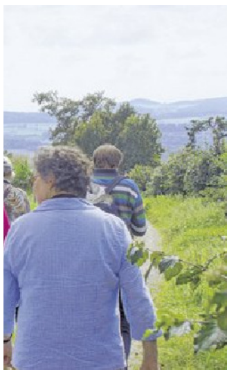
Rebberg im Thurgau.